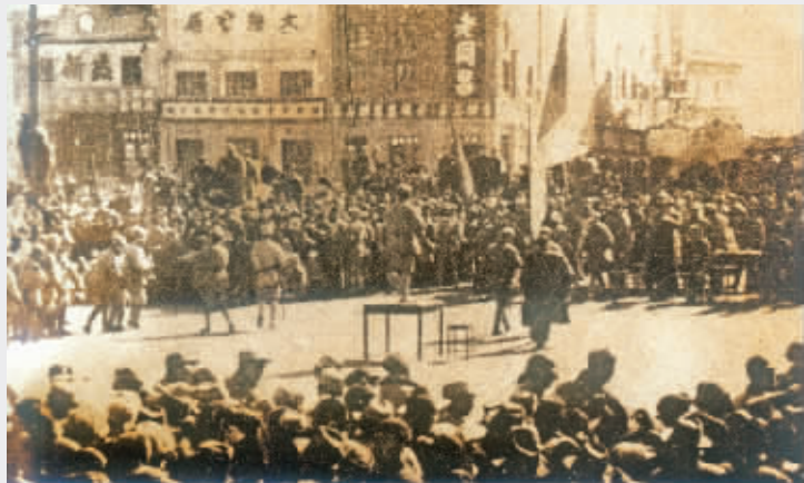
苏北人民庆祝解放