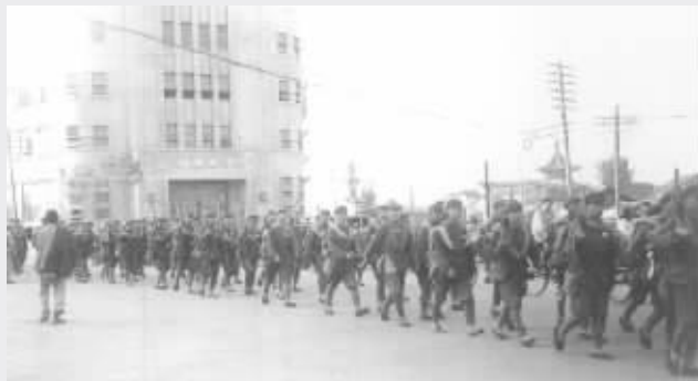
解放军进入南京鼓楼街头