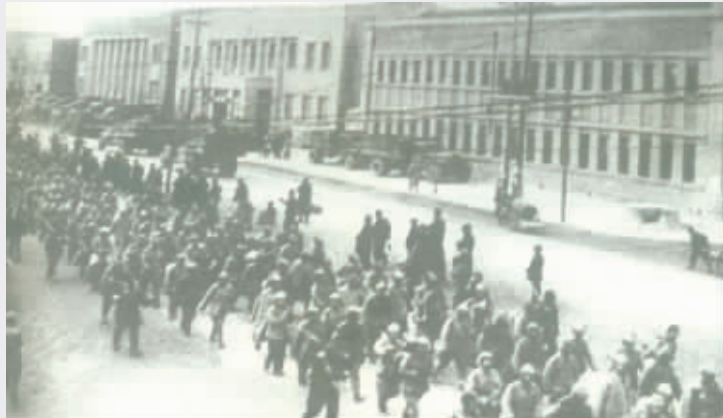
淮海战役中，大量的国民党军被俘官兵从徐州市区通过的情景