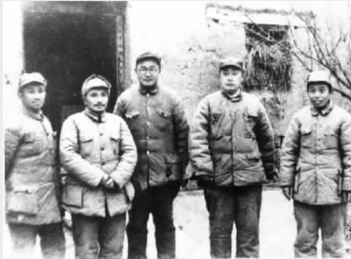
淮海战役前线总指挥委员会委员合影

在人民解放军转入全面反攻，取得了辽沈战役胜利的形势下，中共中央军委决定于1948年11月6日由华东、中原两大野战军联合发动以徐州为中心的淮海战役。战役历时65天，至翌年1月10日胜利结束。淮海战役后，国民党统治集团陷入土崩瓦解状态，我解放军乘胜解放扬州、南通等市、县。4月7日仪征县城解放，至此，除江浦县和极少数沿江据点外，苏北全面解放。4月21日，苏北人民行政公署在扬州成立。