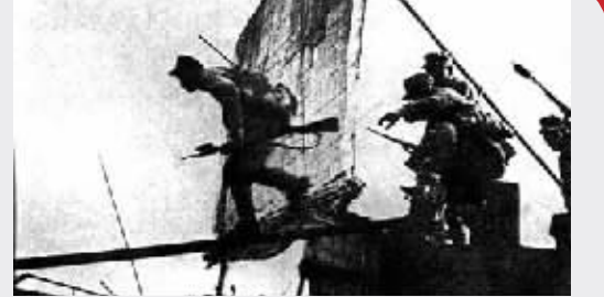
解放军渡江突击队冲上长江南岸