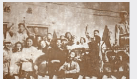
无锡人民欢庆解放