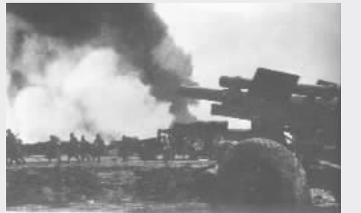
淮海战役的最后一缕硝烟