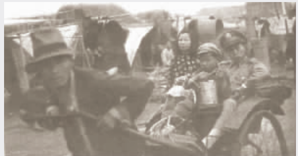
仓皇出逃的国民党军官

由于国民党拒绝在“和平协定”上签字，1949年4月21日，毛泽东主席、朱德总司令发布了《向全国进军的命令》。继三大战役之后，人民解放军发起了规模空前的渡江战役，剑锋直指国民党反动政权的统治中心——南京。百万雄师以排山倒海之势强渡长江，4月23日占领南京，镇江、丹阳、常州、无锡一线相继解放；27日苏州解放；5月1日，苏南人民行政公署在无锡成立；6月2日解放崇明岛，至此苏南全境解放。