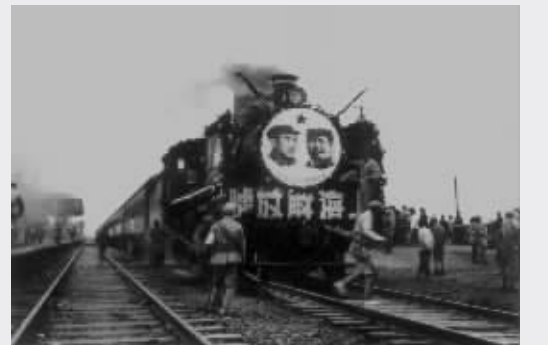
人民解放军解放苏州后，乘胜奔赴解放上海的战场。图为停在苏州火车站的上海解放号。