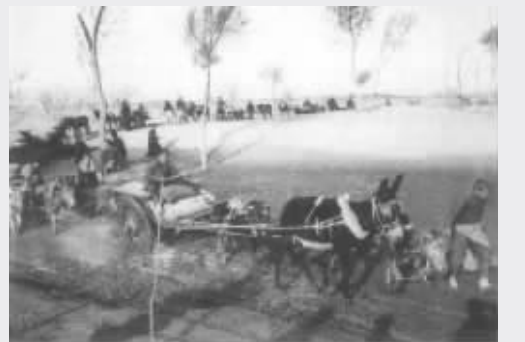
1948年11月，淮海战役支前运输队向前线赶运粮食。