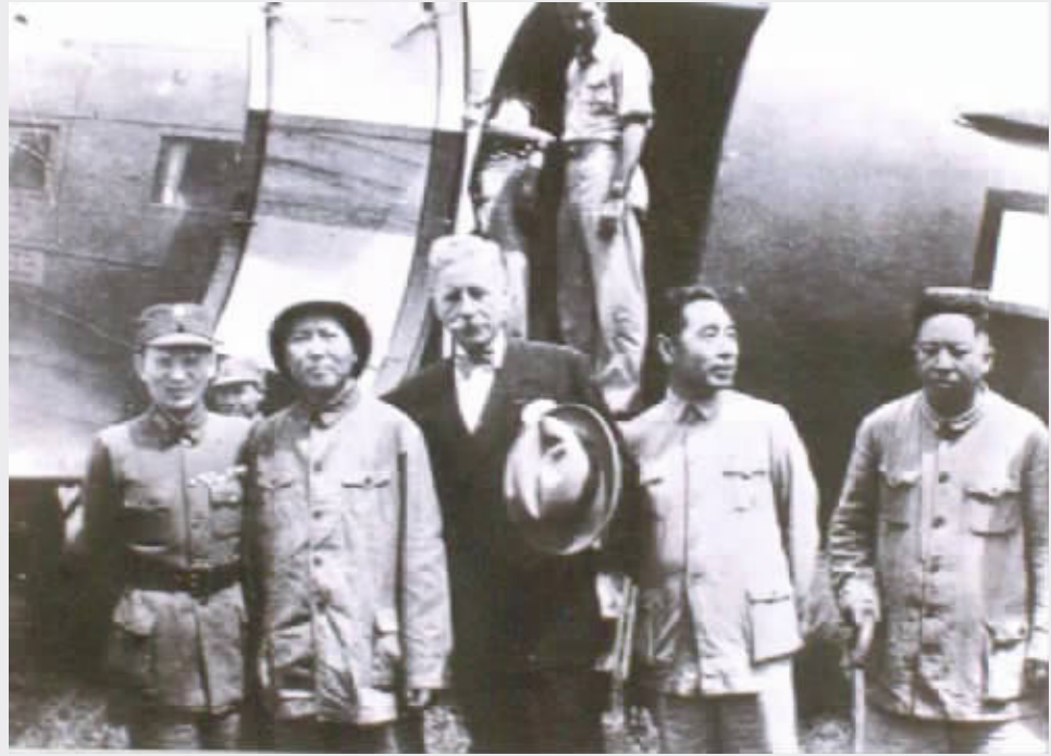
1945年8月29日，毛泽东、周恩来等抵达重庆，与国民党进行和平谈判。