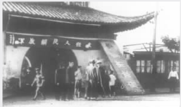
解放军接管国民党南京市政府