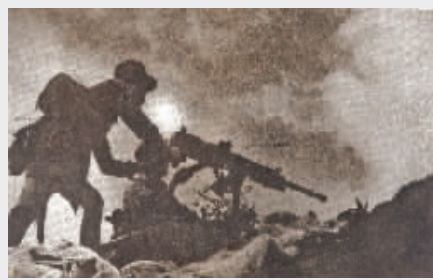
1946年7月苏中战役如(皋)南战斗中，华野机枪手向增援的敌军开火。