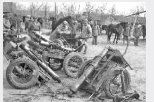
淮海战役中解放军缴获的化学白油