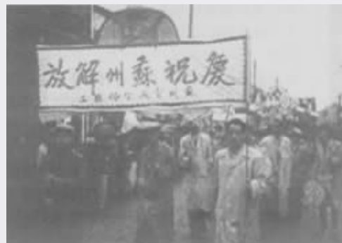
苏州人民庆祝解放