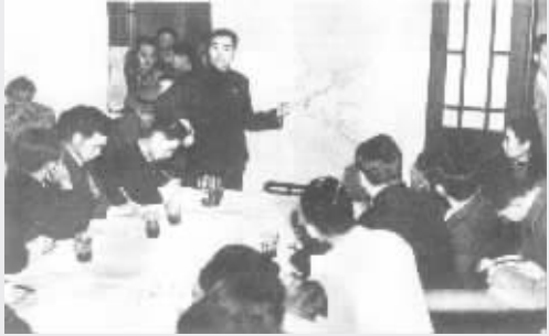
1946年11月周恩来同志在南京梅园新村举行中外记者招待会，以大量事实痛斥蒋介石发动反革命内战，全面进攻解放区的罪行。