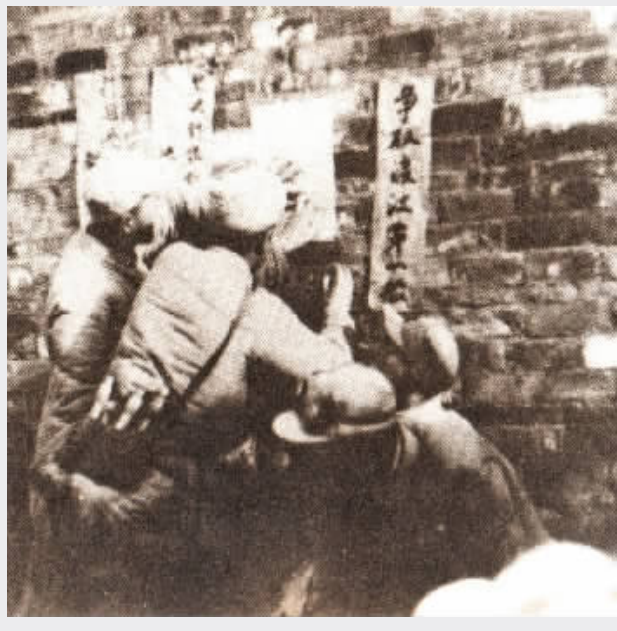
解放军指战员在争取渡江第一船的请战书上签名