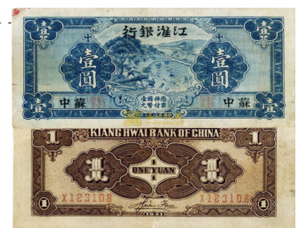
江淮银行发行的货币

根据中央六届六中全会关于“有计划地与敌人发行伪币及破坏本币政策斗争”,“建立地方银行,发行货币”的精神,决定在新四军各师开辟的抗日根据地内分别创建银行和印钞厂,发行货币,以此来对抗日伪货币的侵害,巩固和发展抗日根据地。抗战期间,新四军及根据地民主政府发行抗日货币的机构有60多家,发行各种货币(统称抗币)270余种,其中影响较大的有七家银行及其发行的抗币。