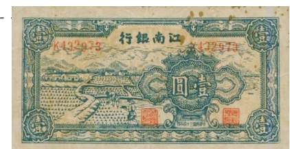
江南银行发行的壹圆抗币

1944年初,苏南地区军民取得反“清乡”、反“清剿”斗争的胜利。为适应抗日根据地市场流通的需要,在苏浙军区领导下筹建江南印钞厂和江南银行。1945年1月,粟裕率部从苏中渡江南进,与谭震林、罗忠毅领导的新四军第六师第十六旅会合,成立苏浙新军区。粟裕率部渡江时从苏中江淮银行带来200万张抗币,在背面加盖“苏浙”二字后发行。3月,江南银行与江南印钞厂同时创办,行长范醒之,厂长孔昭。印制发行壹元、伍元、拾元券抗币,在太湖地区的镇江、无锡、常州、宜兴、江阴、苏州一带流通。9月,新四军