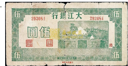
大江银行发行的伍圆抗币

1941年5月,张鼎丞、曾希圣率新四军第七师开辟了以巢县、无为、庐江为中心的皖江抗日根据地。1942年,为支持根据地财政经济,与敌伪货币作斗争,曾希圣建立大江银行,并发行大江币;1943年春,又在朱家庵筹建大江银行,印行面额有1.2分、1.2.5角和1.2.5、10元等大江币。6月,大江银行正式成立,行长由叶进明兼任。其主要任务是:代理金库,发行货币,配合货检、税收、外贸等部门掌