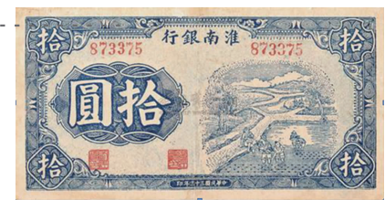
淮南银行发行的货币

张云逸、罗炳辉领导的新四军第二师在皖东开辟了淮南抗日根据地。1942年2月,在江苏盱眙县葛家巷(今属安徽天长县)成立淮南银行,龚意农任行长。同年5月,淮南银行印制和发行淮南币。银行代理金库初设于新四军二师供给部内,后移至银行。总金库负责统一征收各项公款,核发现金支付等。银行还发放生产贷款、救灾贷款、移民贷款和工商贷款。至抗战胜利,淮南银行进行对敌斗争,稳定社会金融及市场物价,保卫