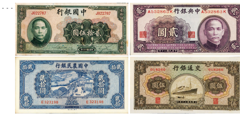
国民政府银行发行的货币,即法币

法币是国民政府银行发行的货币,在国民党统治区和敌后抗日根据地流通。不同于对伪币的斗争,新四军及根据地抗日民主政府采取既联合又排斥的斗争策略,经历了一个保护、联合到限制、停用法币的过程,这也是抗日根据地内法币力量由大到小、抗币力量由小到大大直至确立本位币的过程。