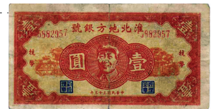
淮北地方银号发行的货币

1941年10月,新四军第四师在淮津浦路东成立淮北苏皖边区行政公署。为稳定抗日根据地金融,与敌伪货币作斗争,1942年6月,在安徽泗县半城镇(现江苏泗洪县境内)“淮北地方银号”正式成立,资本