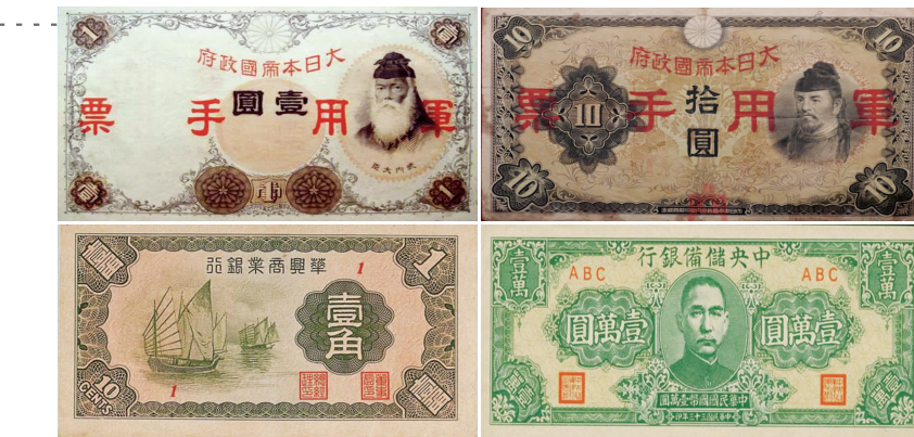
日伪货币:日军用手票、华兴券、中储券

侵华日军在军事进攻的同时进行经济掠夺,日军所到之处烧杀抢掠,千方百计掠夺榨取物资,以补充战争消耗。日军当时通过在占领区滥发军用票,强制流通的手段,掠夺占领区财物。至1939年上半年,流入苏南地区的日本军用票多达3000万元。日军还操纵汉奸伪政权在沦陷区设立银行发行日伪货币,套取中国人民的物资财产,实施经济掠夺。1939年5月,日伪政权在上海设立伪华兴商业银行,发行伪“华兴券”。1941年1月,汪伪政府在南京设立中央储备银行,发行伪“中储券”,在长江中下游伪控制区强行流通,企图建立伪币本位制。伪币是日伪进行经济掠夺的工具,是政治和军事上攻击抗日军民的重要手段,也是日伪的财政支柱。对此,新四军及抗日民主政府采取了禁止日伪货币在根据地流通的斗争策略。