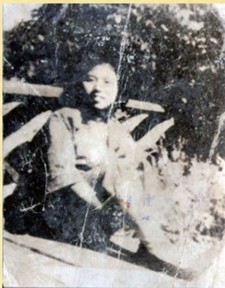
叶邦瑾生前照片(摄于1946年春)

敌人将她押回如皋城，施以酷刑：“灌肚肺”“坐老虎凳”“铁烧胸部”等，轮番上阵，妄图逼迫她供出党的秘密。叶邦瑾总是回答：“不知道！”8月17日，叶邦瑾被押往如皋东门刑场。临刑前，敌人蒙蔽她的双眼。叶邦瑾怒火满腔，痛斥敌人：“祖国河山是人民的，为什么不准看！”最后她又高呼：“共产党万岁！”“自卫战争一定要胜利！”敌人恼羞成怒，杀害叶邦瑾后，解体剖心，抛尸荒野。当天夜里，几个素不相识的贫苦农民冒着生命危险，偷偷地含泪在自家的小块田里，埋葬了叶邦瑾的残尸。